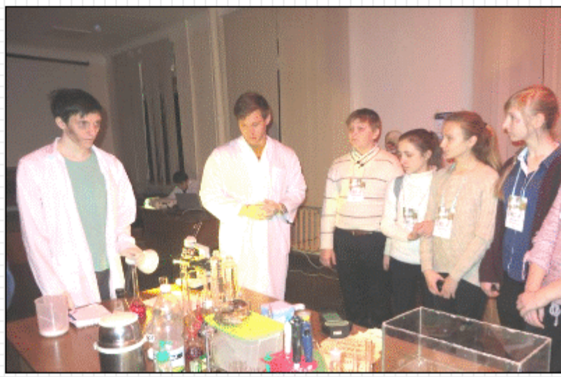
В секретной лаборатории