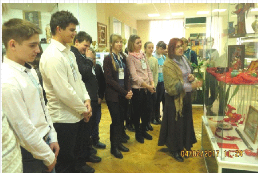
В музее ВГУ

Также мы приняли участие в программе «Юный криминалист», подготовленной юридическим факультетом. Было очень увлекательно почувствовать себя детективом и узнать, как снимаются отпечатки пальцев, оставленные на каком-то предмете преступником.