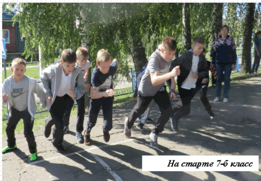
На старте 7-б класс

С 11 по 16 сентября в гимназии проходили спортивные мероприятия, посвященные Дню физкультурника Воронежской области. Завершились они в субботу, 16 сентября, праздником «Осенний кросс». После уроков ученики 2-11 классов по параллелям приняли участие в эстафете, а затем желающие пробежали кросс.