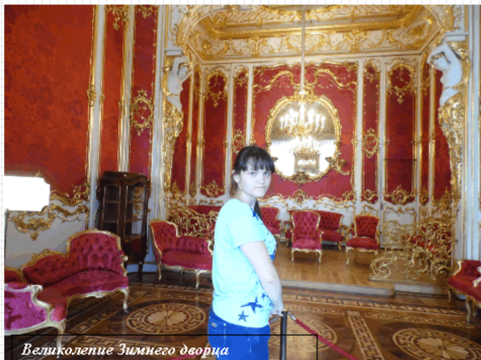
Великолепие Зимнего дворца

В Новгороде мы также побывали во многих православных соборах, храмах, церквях. Там их так много, что, как мы ими старались, но нам не хватало времени посетить и половину из тех, что сохранились на этой старинной земле. Здесь немало музеев и памятников, отражающих историю нашего народа, выделено рекордное количество объектов Всемирного наследия «Юнеско» – целых 37! Великий Новгород удивителен не только историческими объектами, созданными руками человека, но и не менее прекрасными памятниками природы. Одним из таких объектов на Новгородской земле является река Волхов, меняющая своё направление раз в 100 лет. Это происходит из-за того, что меняется уровень в озёрах Ильмень (истоке реки) и Ладожском (её устья). Озеро Иль-