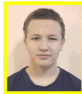
Корчииков Артем председатель комитета «Труд и порядок»