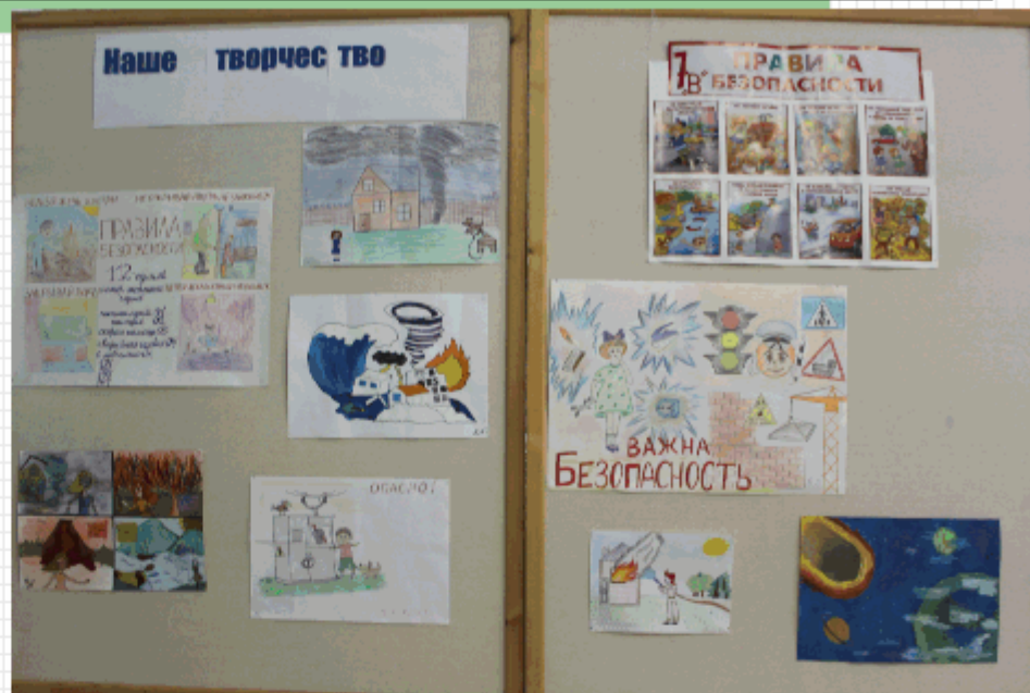
Выставка плакатов о безопасности