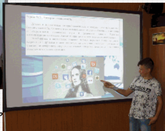
На уроке по компьютерной безопасности в 8-а

Завершилась игра конкурсом капитанов команд.