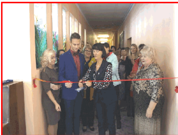
Самый торжественный момент!