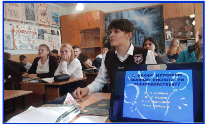
Фрагмент интеллектуальной игры в 9-б кл.

Пятиклассники, например, нам признались, что именно с этих занятий начался их интерес к изучению естественных наук.