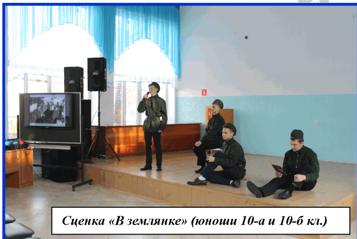
Сценка «В землянке» (юноши 10-а и 10-б кл.)