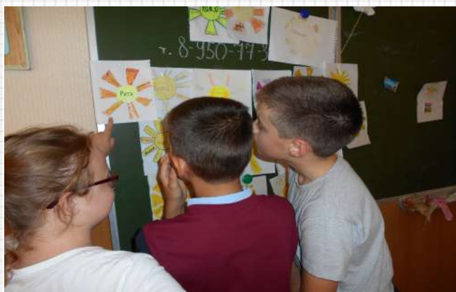
Ученики 5-б в лучах дружбы

С 9 по 18 сентября прошел «Осенний марафон здоровья». Проведено много мероприятий, среди которых – новинка для гимназистов 7-8 классов – физкультурный рогейн. Этапы соревнований были очень оригинальными и вызвали у ребят неподдельный интерес.