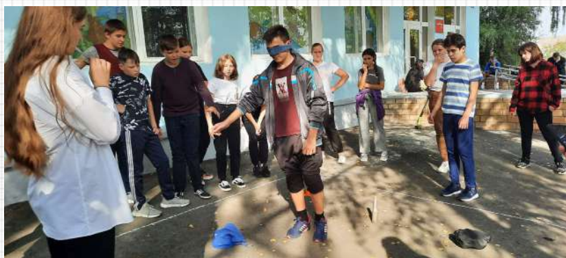
7-а на одном из этапов физкультурного рогеина

На фото справа запечатлен эпизод занятия «Я в лучах солнца», проведенного психологом гимназии Бaeвой М.А. в 5-б классе. Цель занятия – повышение самооценки и сплочение коллектива. Ребята называли положительные качества каждого одноклассника и записывали их на солнечных лучах. В честь каждого загоралось своё солнце! К концу урока на классной доске сверкали яркие солнца, освещающие всех участников игры лучами дружбы!