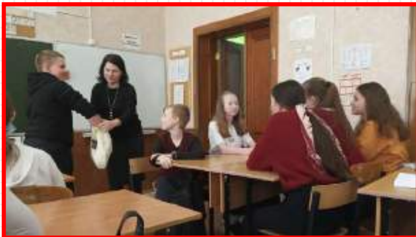
«Что? Где? Когда?» в 7-б классе