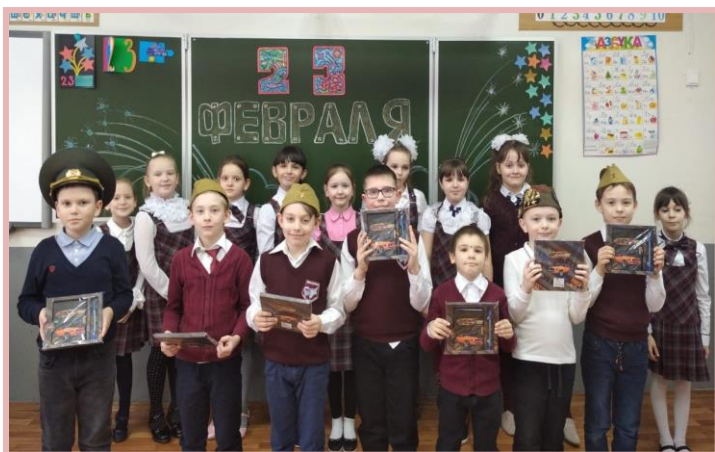
На фото - 2-6 класс после утренника

Во всех классах гимназии прошли праздничные утренники, классные часы. Там мальчишки прошли проверку на силу, ловкость, смекалку, галантность, домовитость. Проигравших не было! А еще мальчишек ждали подарки: девчонки очень старались!